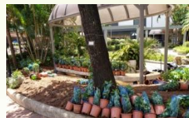
種植花卉穩定樹木