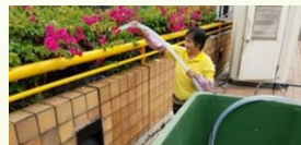
用收集之淨化雨水澆花