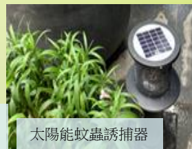
太陽能蚊蟲誘捕器