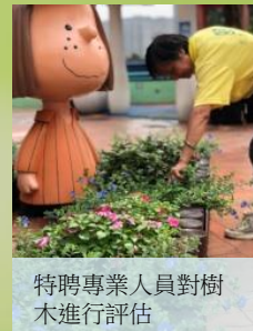
特聘專業人員對樹木進行評估