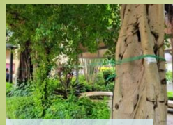
監察樹木傾斜情況

在園林運用太陽能加熱水或空氣，延長植物生長季節，促進生長，提供舒適環境。同時節能環保，保護勞工安全，減少火災、有害排放和溫度風險。