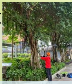
樹藝師定期檢查及修剪